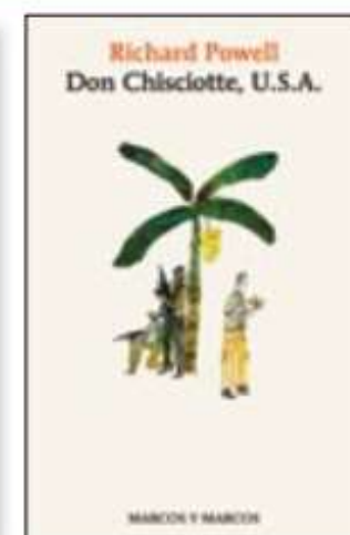
DON CHISCIOTTE, U.S.A. di Richard Powell, Marcos y Marcos, pag. 336, 20 €