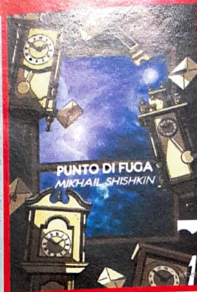
PUNTO DI FUGA MIKHAIL SHISHKIN