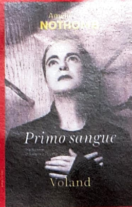
Amélie NOTHOMB Primo sangue Voland